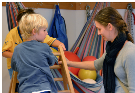
Spielen – ausprobieren – entdecken