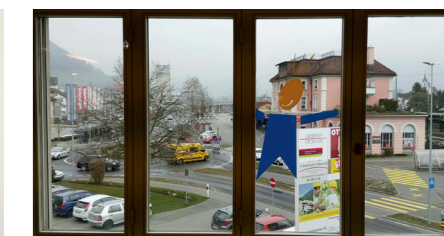
Die Therapiestelle ist gut erreichbar. Sie liegt ideal gegenüber dem Bahnhof in Brunnen.